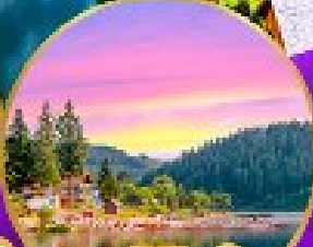
ทิกเซ่ ปาด้า