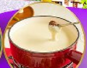
ฟองคูชีส