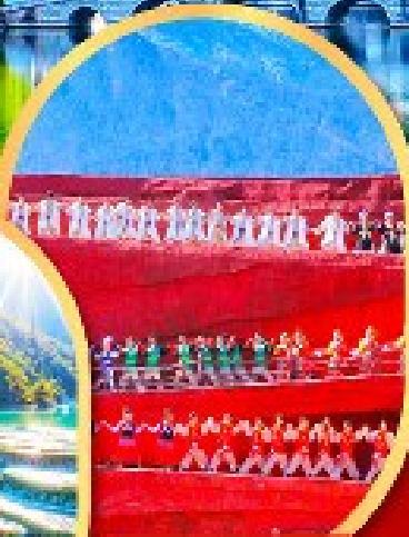
โชว์ Impression Lijiang