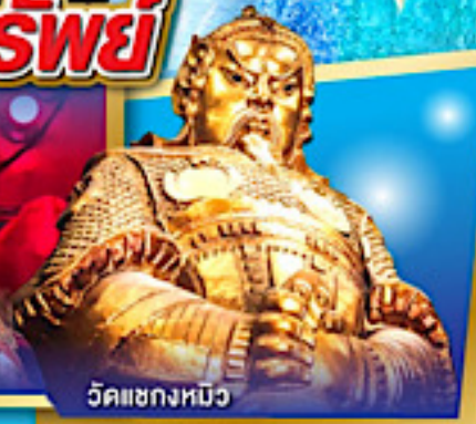
วัดเขกงหนิว