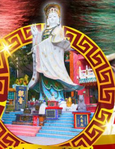
เจ้าแม่กวนอิม หาดริฟส์สีย์