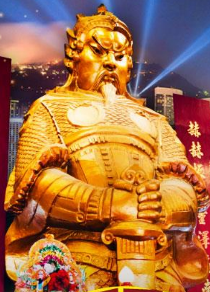
赫赫有名 聖潔淨潔 南無