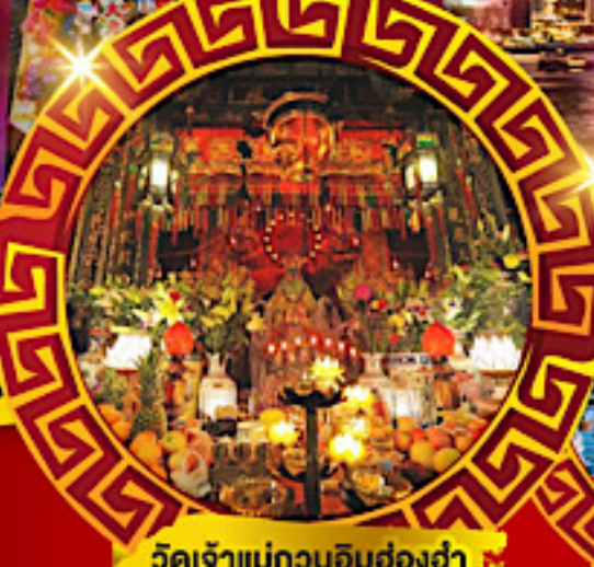
วัดเจ้าแม่กวนอิมซ้องฮำ