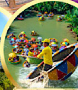
ล่องเรือกระดัง