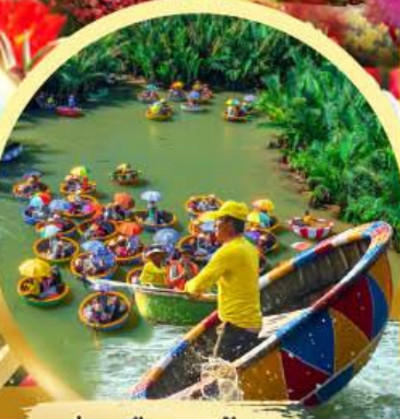
ล่องเรือกระดัง