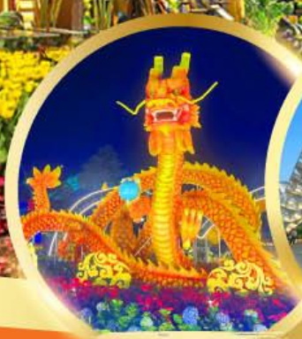
สะพานมังกรพันไฟ