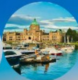
Victoria, British Columbia (Canada)