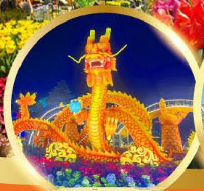
สะพานมังกรพันไฟ