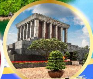
สุสานลุงโฮ