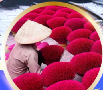
หมู่บ้านรูป Phu Cau