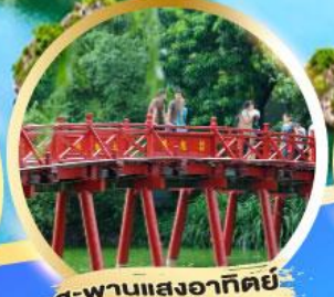
สะพานแสงอาทิตย์