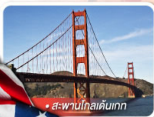
สะพานโกลเดนเกต