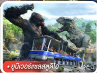
ยูนิเวอร์แซลสตุ๊ดไอ