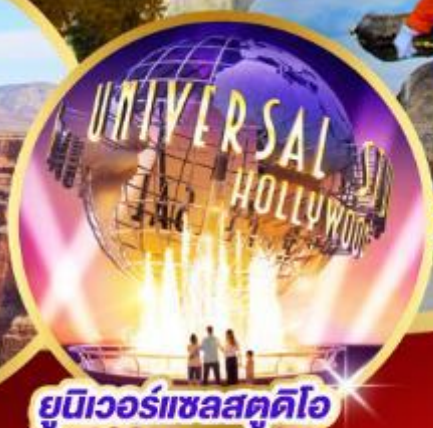
ยูนิเวอร์แซลสตูดิโอ