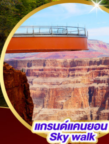
แกรนด์แคนยอน Sky walk