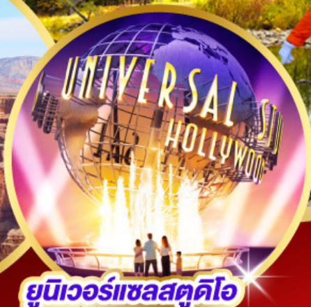
ยูนิเวอร์แซลสตูดิโอ