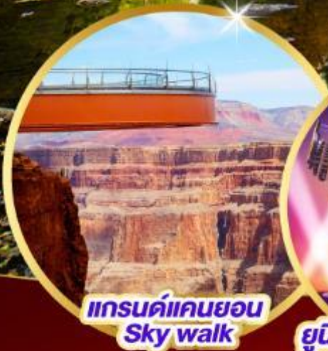
แกรนด์แคนยอน Sky walk