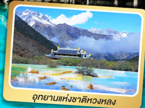
อุทยานแห่งชาติหลวงหลอง