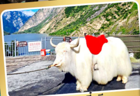
ทะเลสาบเตี้ยซี