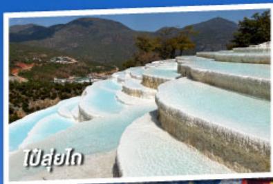
ป๋ายู่ไถ่

เที่ยวครบทุกไฮไลต์ • ไม่ลงร้านช้อปปิ้ง • พักโรงแรม 4 ดาว