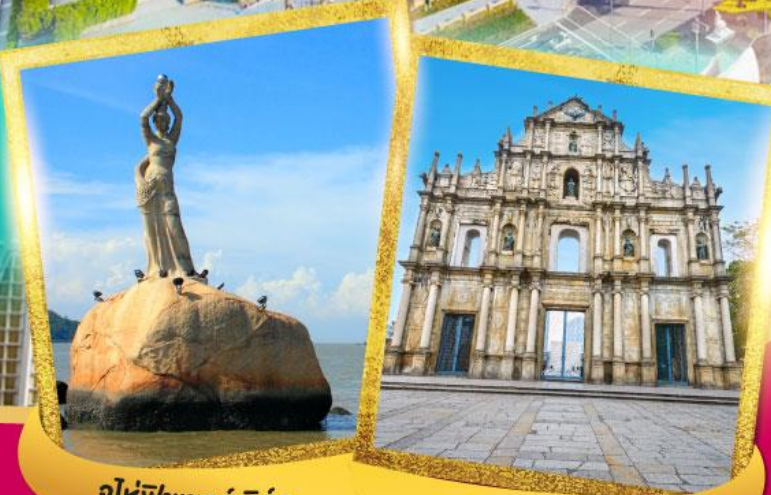
จูไห่พีชเชอร์เกิร์ล