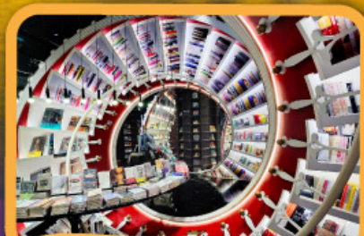
• ร้านหนังสือจุงซูเก้อ