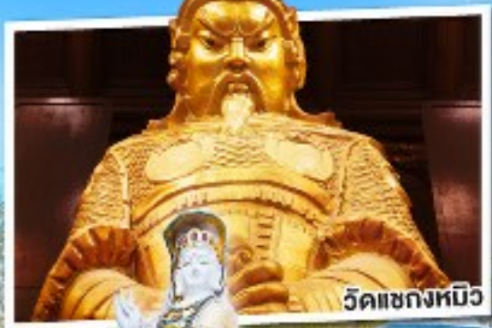
วัดเข่งหมิว