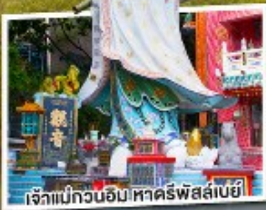
เจ้าแม่กวนอิม หาดริพัลลีย์