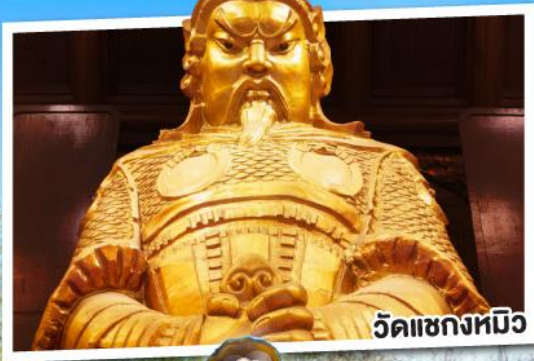
วัดเซ่งหมีว