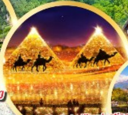
Nabana No Sato Illumination