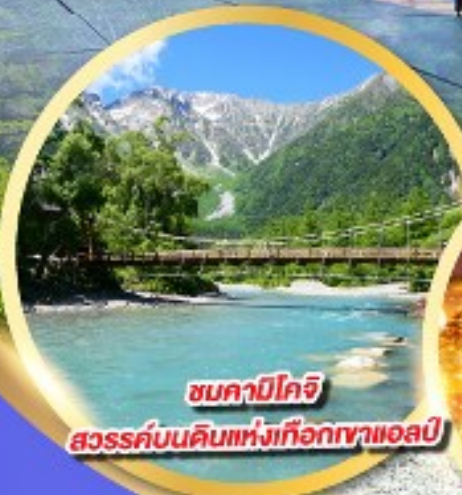
ชมคาบิโคจิ

นั่งกระเช้าลอยฟ้า 2 ชั้น ชินโฮทากะ หนึ่งเดียวในญี่ปุ่น แลนด์มาร์กยอดฮิตของโอคุซิดะ