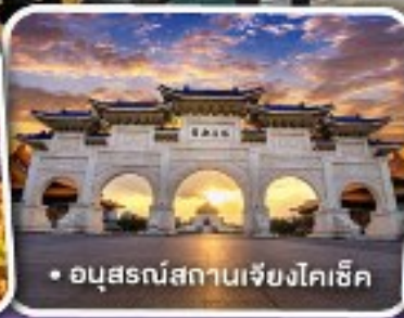
• อนุสรณ์สถานเจียงโคเช็ค