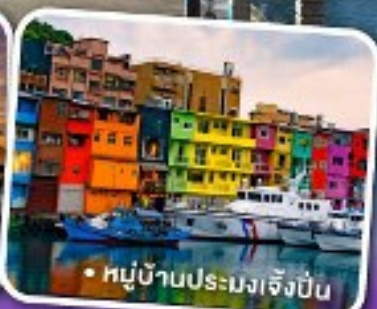
• หมู่บ้านประมงเจิ้งปิ่น