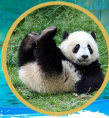
หมีแพนด้า