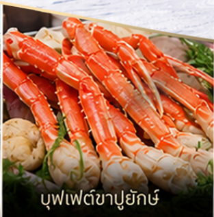
บุฟเฟ่ต์ซาปูยักซ์