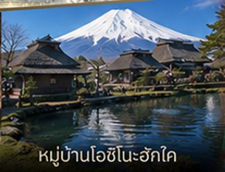
หมู่บ้านโอชิโนะอ๊กโค