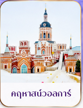
เทศกาลแกะสลักน้ำแข็ง Harbin Ice and Snow Festival