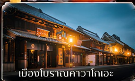
เมืองโบราณคาวาโกเอะ