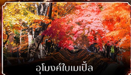
อุโมงค์ใบเมเปิ้ล