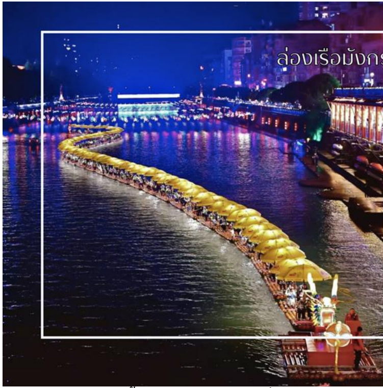
ล่องเรือมังกรแม่น้ำก้งส่วย