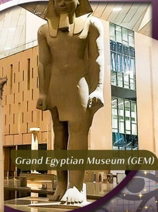
Grand Egyptian Museum (GEM)

คอนเฟิร์มออกเดินทาง ตั้งแต่ 15 ท่าน ขึ้นไป