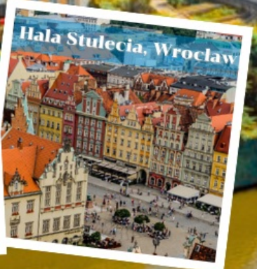
Hala Stulecia, Wrocław