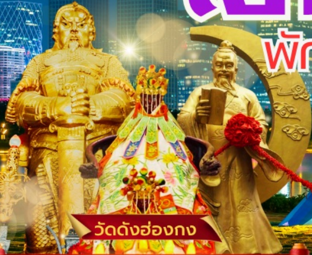
วัดดั่งฮ่องกง