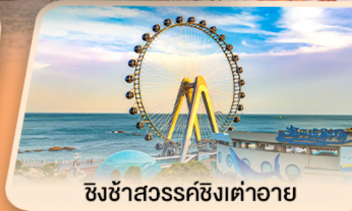
ชิงช้าสวรรค์ซิงเต่าอาย