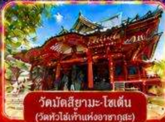
วัดมิตสึยามะ-โชเต็น (วัดหัวไร่เก่าแห่งอาซากุสะ)