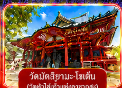
วัดมิตสึยามะ-โชเด็น (วัดหัวไข่แห่งอาซากุสะ)