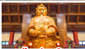
วัดซ่งกวงหมิว