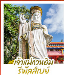
เจ้าแม่กวนอิมรัฟัสบี้