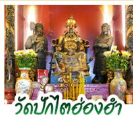
วัดปึกโตฮองฮำ