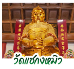
วัดเซ่งก้งเมิว