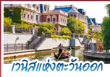
เวนิสแห่งตะวันออก