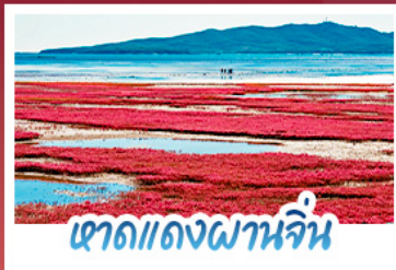
เขาดแดงผานจีน