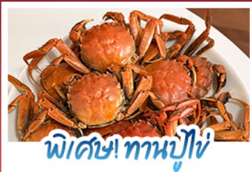
พิเศษ! ทานปูไข่

ปรากฏการณ์ธรรมชาติ 1 ปี มีแค่ครั้งเดียว! เตรียมชุดกันไปถ่ายรูปกับ 'หาดแดงผานจีน' ที่กำลังพรมสีแดงสดไปทั่วผืนน้ำ พร้อมฟินสุดขีดกับฤดูกาลทานปูไข่ที่ดีที่สุดแห่งปี • สัมผัสเวนิสแห่งตะวันออกที่ด้าหลียน