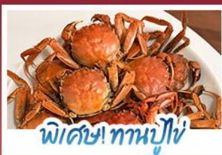
พิเศษ! ทานปูใหญ่

ปรากฏการณ์ธรรมชาติ 1 ปี มีแค่ครั้งเดียว! เตรียมชุดเก่งไปถ่ายรูปกับ 'หาดแดงผานจีน' ที่กำลังพรมสีแดงสดไปทั่วผืนน้ำ พร้อมฟินสุดขีดกับฤดูกาลทานปูที่คึกคักที่สุดแห่งปี • สัมผัสสวนนิลแห่งตะวันออกที่ต้าเหลียน