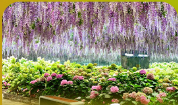
สวนนกเป็ดน้ำ