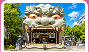
ศาลเจ้านัมบะ ยาชากะ