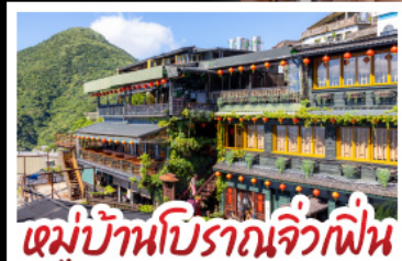
หมู่บ้านโบราณจิวฝิน