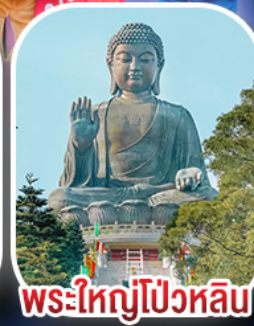
พระใหญ่โป่วหลิน