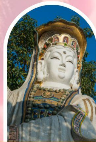
ริพลัสเบย์ รับพลังงานดี เสริมพลังฮวงจุ้ย