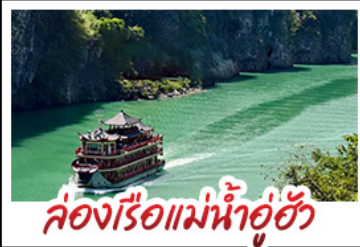
ล่องเรือแม่น้ำอู่ฮิว

ฉงชิ่ง - อู่หลง - เจียนเจียง หลุมฟ้าสามสะพานสวรรค์ - หงหยาดัง พุทธศิลป์ต้าจู้ - ล่องเรือแม่น้ำอู่ฮิว