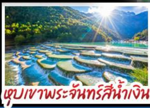
ตูปเขาพระจันทร์สีน้ำเงิน