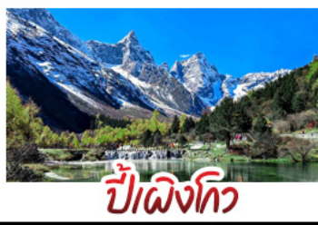
ปี่ผิงโกว