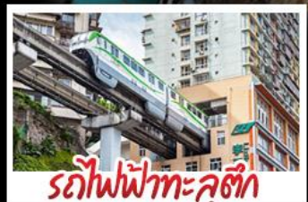
รถไฟฟ้าทะเลสาบ