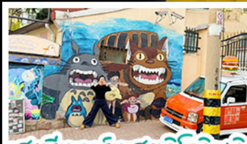
สตรีทอาร์ต สตุตโฮจิบลิ