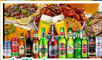
เบียร์ซิงเต่า + อาหารทะเล