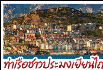
ท่าเรือชาวประมงเยียนไถ