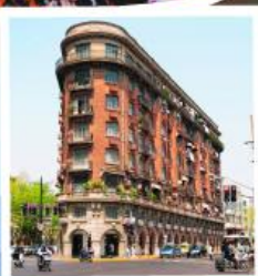
ถนนอู่คิง