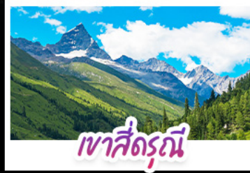
เขาสือรณี