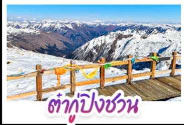
ต้ากู่ปิงชวณ