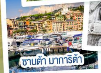
ซานต้า มารีตา