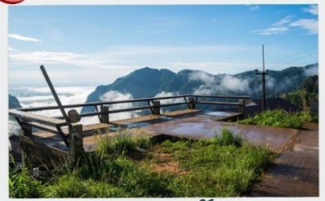
ดอยฟ้าฮี้