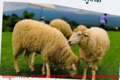
ฟาร์มแกะ