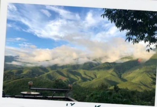
หมู่บ้านสะปัน