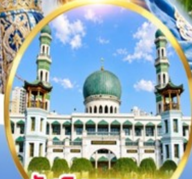
มัสยิดตงกวน