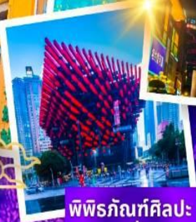
พิพิธภัณฑ์ศิลปะ ฉงชิ่ง