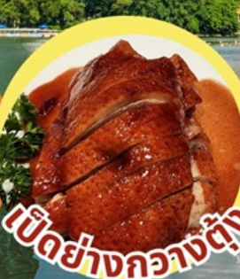
เป็ดย่างกวางตุ้ง