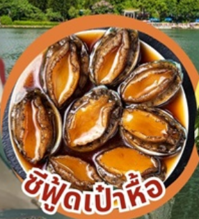
ซีฟู้ดเป่าหื้อ