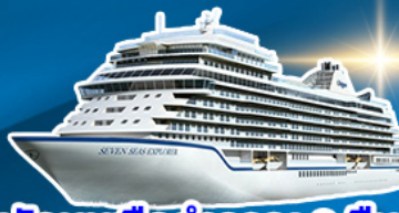
พักผ่อนเรือสำราญ 2 คืน